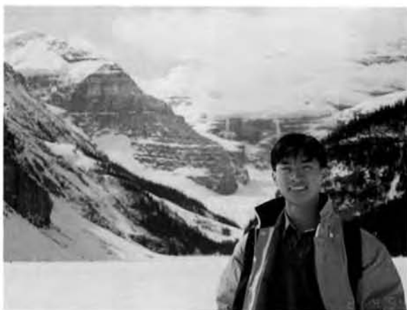
在Lake Louise, 背面為冰封的湖面和洛磯山脈